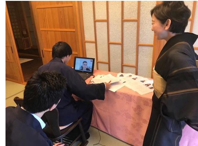
インドネシア現地とZOO面接 (箱根の旅館にて)