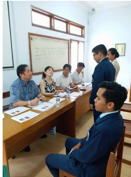
現地での会社説明会、面接 (BALI観光系大学内)